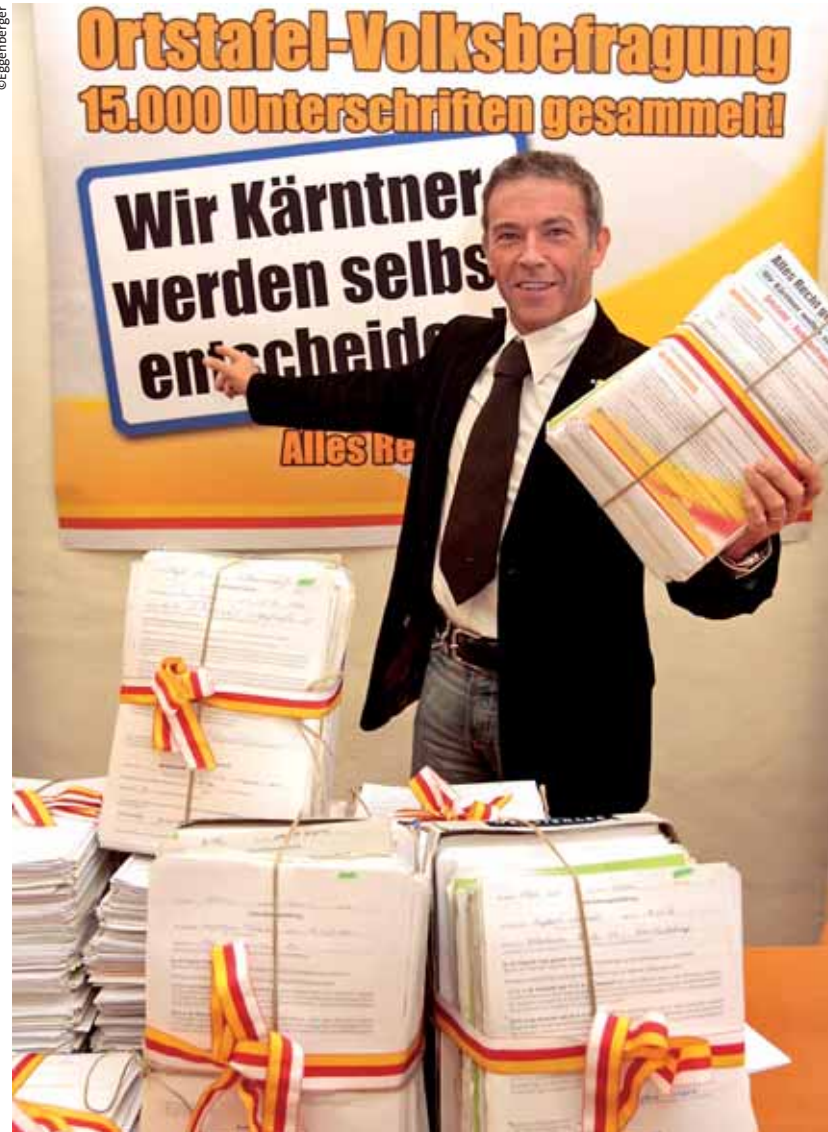
LH Jörg Haider mit den Unterschriften der Kärntnerinnen und Kärntner

Haider fordert jedenfalls eine endgültige und per Verfassungsbestimmung gesicherte Lösung in der Ortstafelfrage: „Es soll nicht mehr möglich sein, dass Schnelfahrer neue Verfahren provozieren und dabei andere Verkehrsteilnehmer gefährden.“ Vorrang haben für den Landeshauptmann der soziale Frieden und das positive Zusammenleben im Land. ■