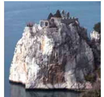
Schloss Duino bildete den idealen Rahmen für die Kulturreise

Nicht zuletzt aufgrund des großen Erfolges dieser Veranstaltung möchte Martin Strutz die Kulturreisen zu einem monatlichen Fixpunkt machen. Nächstes Ziel wird die Lagunenstadt Venedig sein, die Planungen laufen auf Hochtouren. Informationen zu den Kulturreisen erhalten Sie unter 050 536 30532 (Petra Röttig, Landeskulturrabteilung). ■