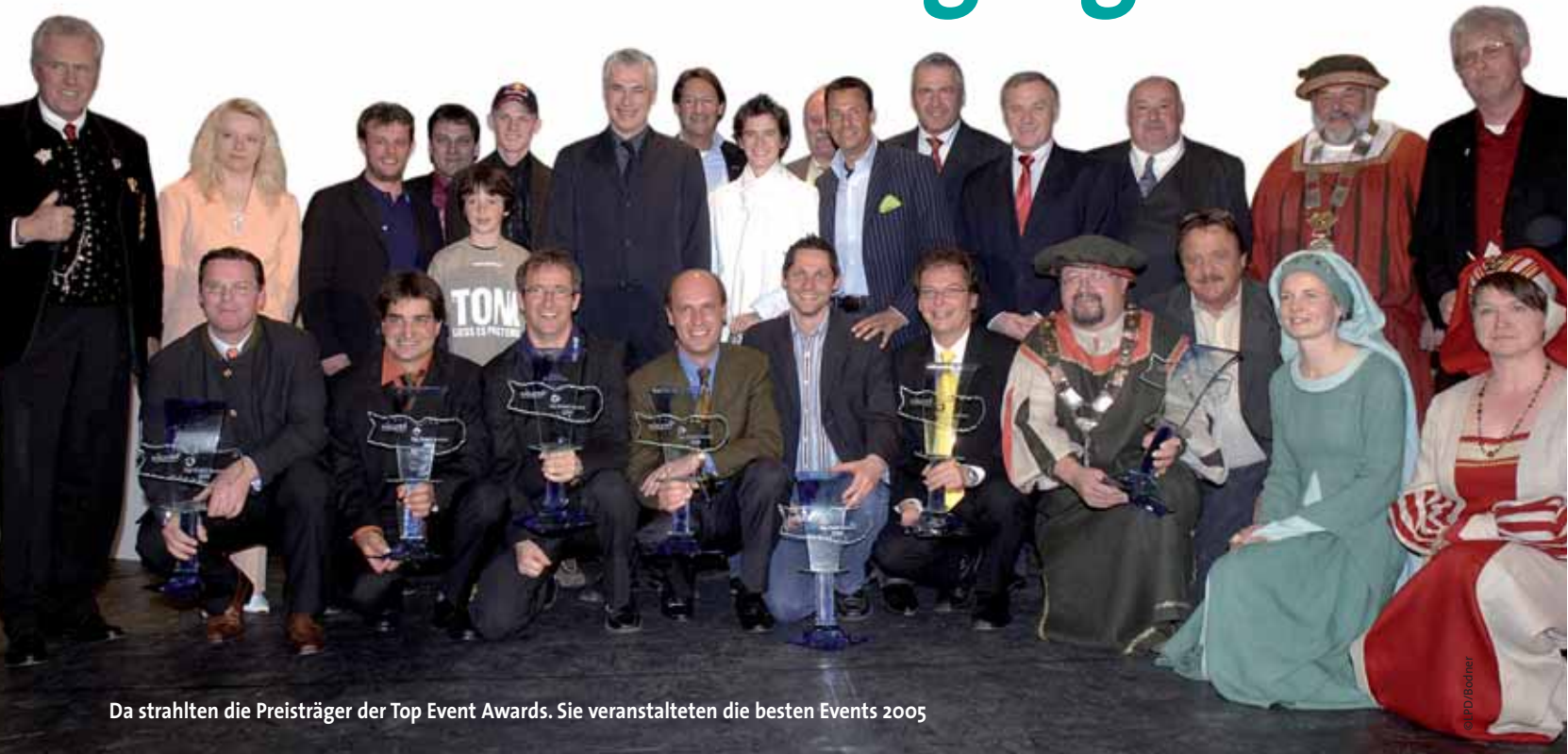
Da strahlten die Preisträger der Top Event Awards. Sie veranstalteten die besten Events 2005