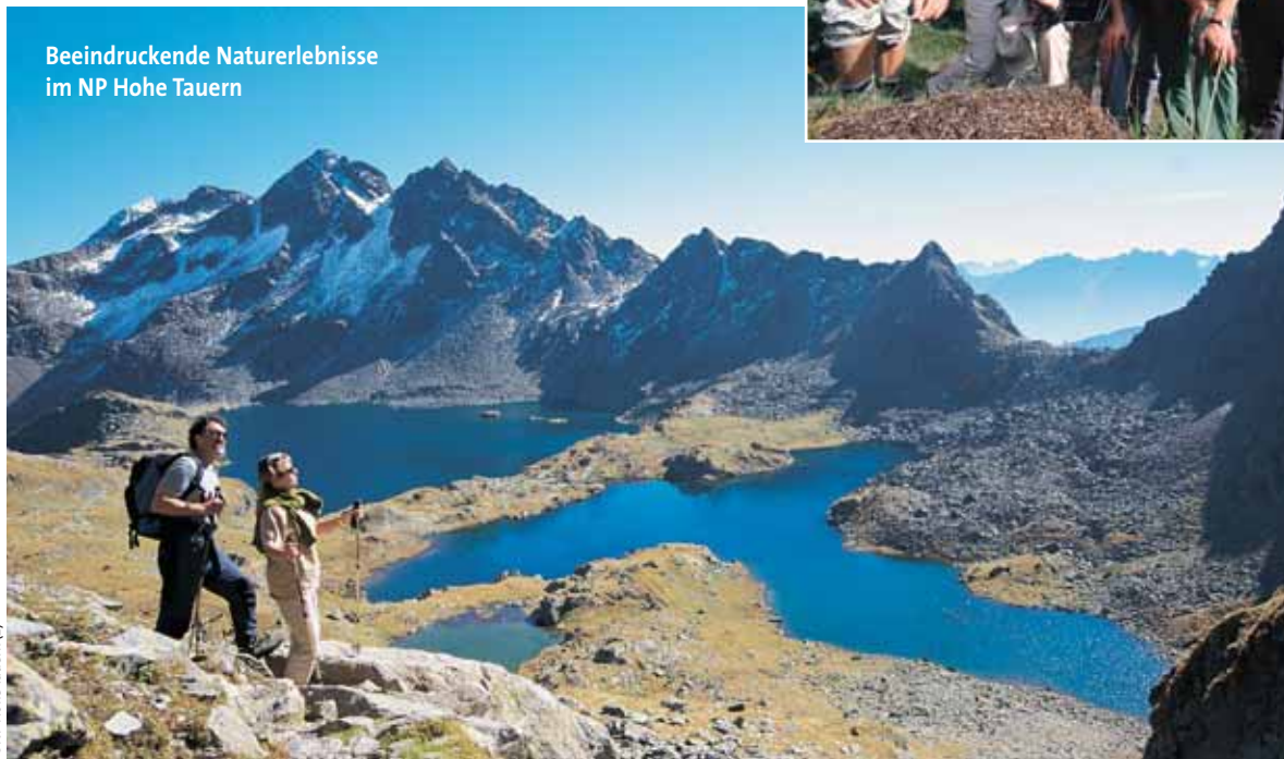
Beeindruckende Naturerlebnisse im NP Hohe Tauern

Nun soll der Nationalpark noch stärker touristisch belebt werden, wie Nationalparkreferent Landeshauptmann Jörg Haider sagt. Haider will damit für die Bewohner der NP-Region einen wirtschaftlichen Vorteil schaffen. Man setzt auf direkt buchbare Ganzjahres-Angebote, wobei „Alpinerlebnis“