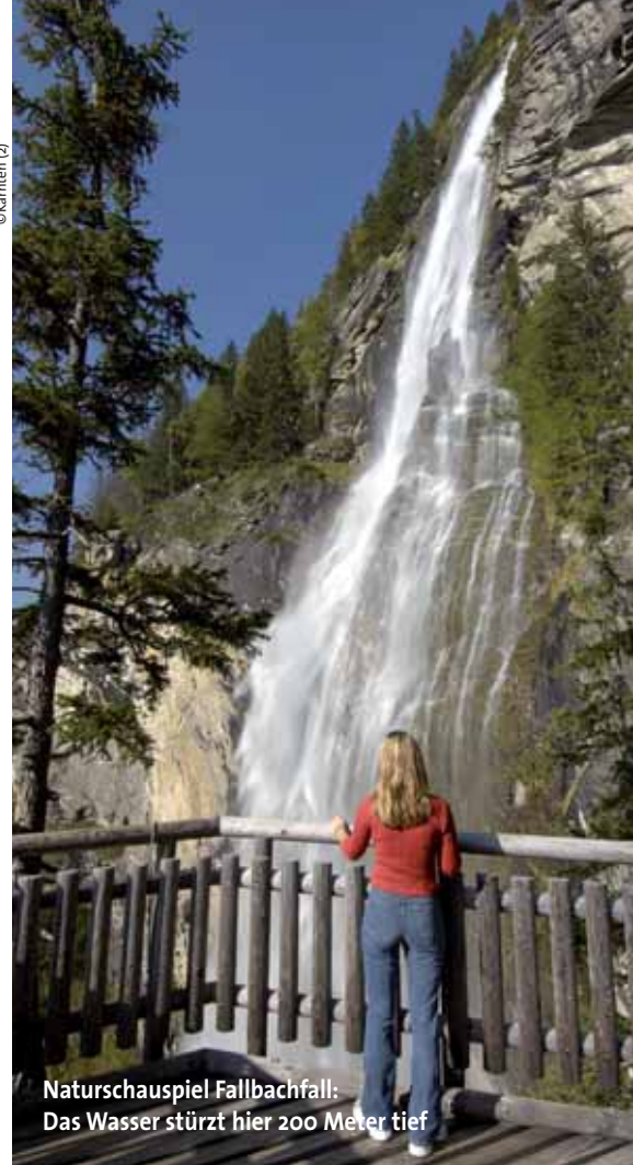
Naturschauspiel Fallbachfall: Das Wasser stürzt hier 200 Meter tief

Die Erlebnisreise WasserKraft bietet eine Vielfalt an Natur- und Kulturzielen. Man präsentiert die Attraktionen authentisch und überzeugend, womit eine sanfte und nachhaltige Auseinandersetzung mit bodenständigen Stärken und regionalen Besonderheiten