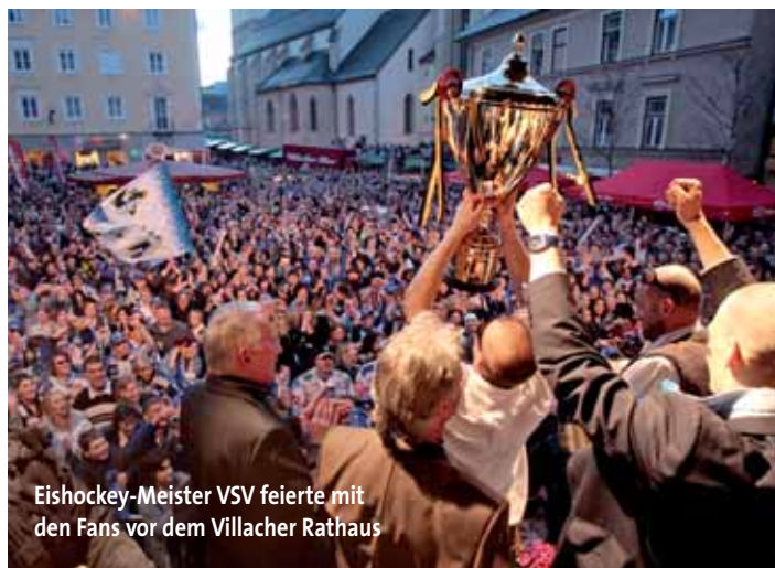
Eishockey-Meister VSV feierte mit den Fans vor dem Villacher Rathaus