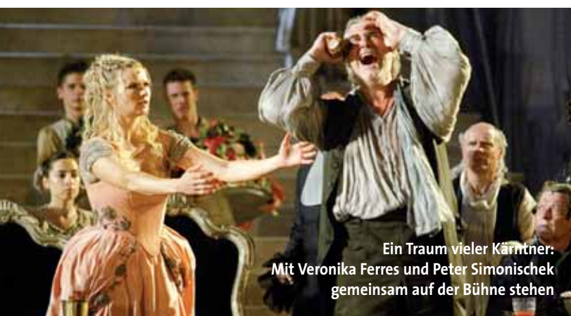
Ein Traum vieler Kärntner: Mit Veronika Ferres und Peter Simonischek gemeinsam auf der Bühne stehen

Aufnahmeprüfung: 7., 8., 9. Juli 2006 Anmeldeschluss: 30. 6. 2006 Mindestalter: 17 Jahre Höchstalter: 25 Jahre Nähere Informationen und Anmeldeformular: Kärntner Landeskonservatorium, Tel.: 0463/ 536 40 510 www.martinstrutz.at www.konse.at