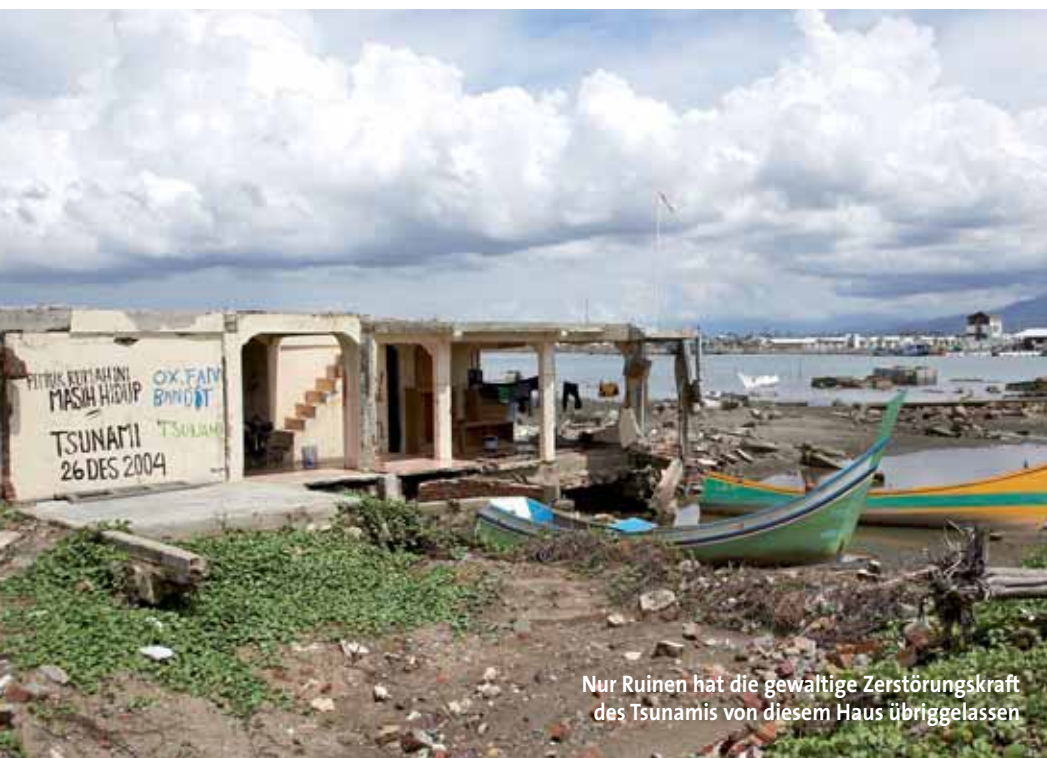
Nur Ruinen hat die gewaltige Zerstörungskraft des Tsunamis von diesem Haus übriggelassen

Das Gras ist nachgewachsen. Auch die Palmen sind längst wieder grün. Nur bei genauem Hinsehen fallen die Laubbäume auf, die als vereinzelte kahle Gerippe in der Landschaft stehen. Ihre tiefen Wurzeln sind verätzt von den Tonnen von Salz, das das Meerwasser metertief in den Boden geschwemmt hat. Es wird Jahre dauern, bis der Regen dieses Salz aus dem Boden gespült hat, bis auch die Laubbäume wieder wachsen können in Aceh.