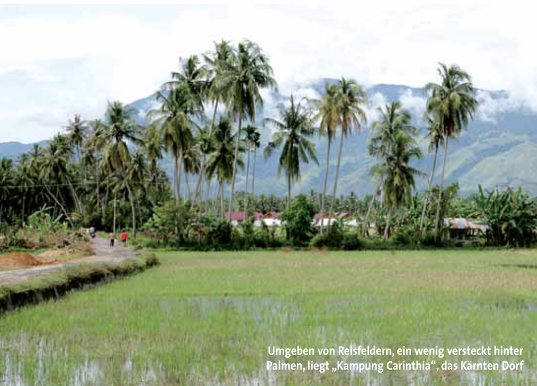
Umgeben von Reisfeldern, ein wenig versteckt hinter Palmen, liegt „Kampung Carinthia“, das Kärnten Dorf

Eineinhalb Jahre nach dem Tsunami haben die Menschen von Aceh wieder Kraft geschöpft. Hilfsprojekte wie das „Kärnten Dorf“ machen Hoffnung