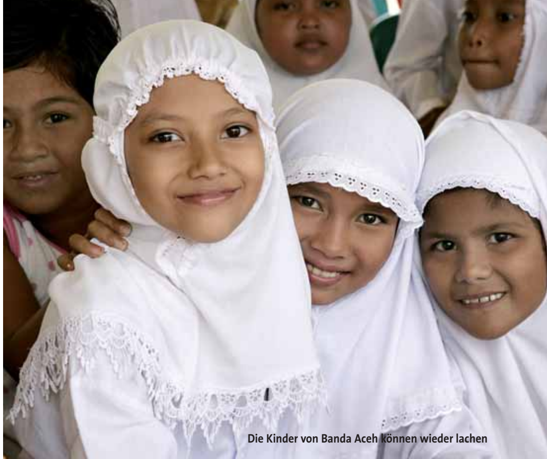
Die Kinder von Banda Aceh können wieder lachen

Rund um eine schon bestehende Moschee und eine Volksschule wurden zwölf Wohnhäuser für je zwölf Kinder mit zwei Betreuern errichtet. Dazu kommen zwei behindertengerechte Gemeinschaftshäuser, ein „Social Center“ für zwölf beeinträchtigte Kinder, eine Kranken- und Therapiestation mit einem Ärztehaus, sowie eine Lehrwerkstätte. ■