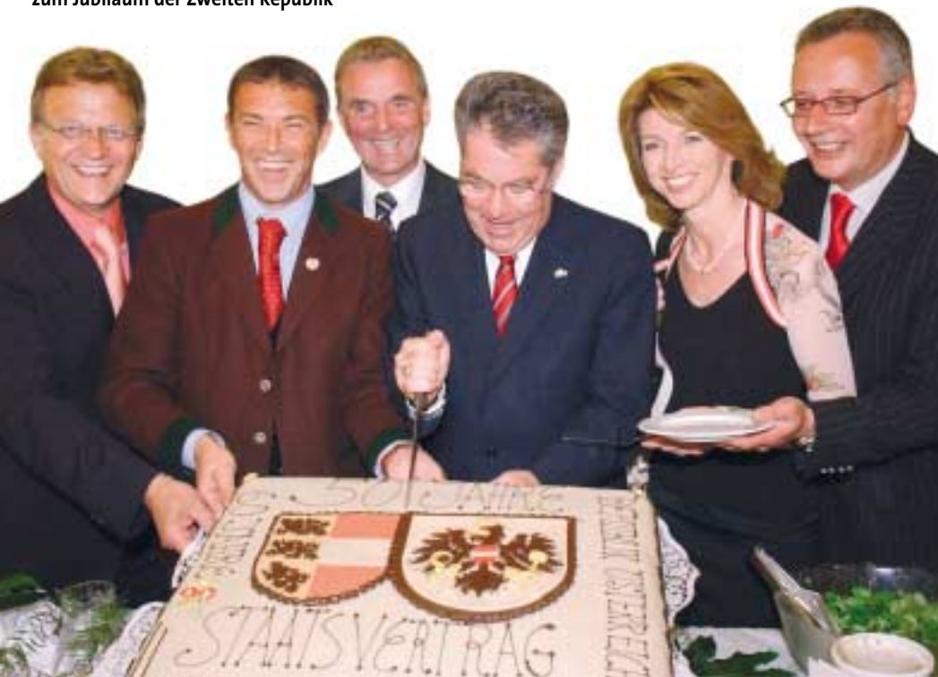
BP Fischer mit Kärntens Politspitze bei Feier zum Jubiläum der Zweiten Republik

Ganz Österreich feierte das „Gedankenjahr 2005“ und auch in Kärnten reihte sich eine interessante Veranstaltung an die andere. Die Teilnahme von Bevölkerung, Vereinen und Traditionsverbänden war überwältigend, so konnten mehr als 15.000 Besucher bei den 26 verschiedenen Veranstaltungen gezählt werden. Neue Einblicke in das Alltagsleben der Nachkriegszeit eröffnete beispielsweise das Kärntner Landesarchiv in einer Ausstellung zum Österreichischen Staatsvertrag, die dann auch auf Tournee in Kärntens Schulen ging. Von Buchpräsentationen und Zeitzeugenabenden bis hin zu Volkskulturfesten und Fotoausstellungen reichte der Bogen. Ebenfalls am Festprogramm standen ein Benefizkonzert und eine hochkarätige wissenschaftliche Tagung über die Kärntner Perspektiven zum Staatsvertrag.