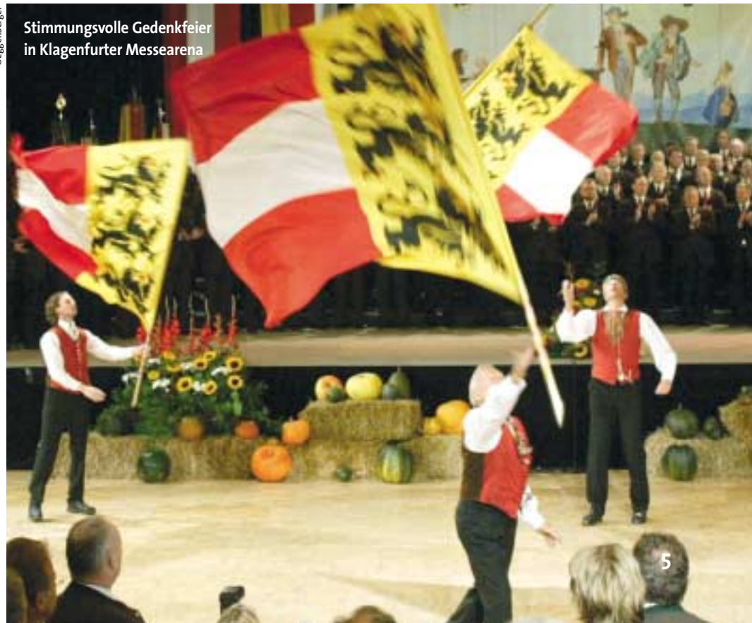
Stimmungsvolle Gedenkfeier in Klagenfurter Messearena