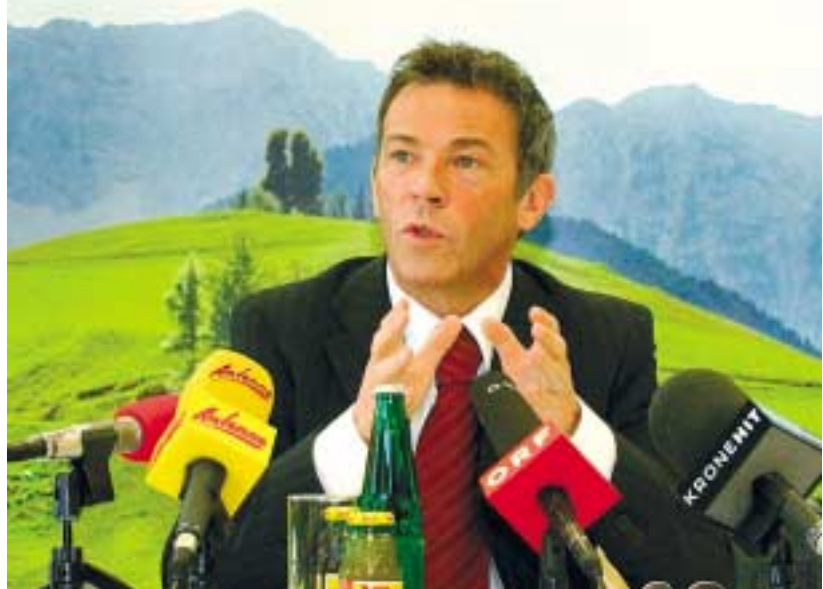
LH Haider initiiert Kleinstgewerbeförderung

Wirtschaftsreferent ausführt, gibt es auch eine Arbeitsplatzprämie. Für jeden zusätzlichen Beschäftigten wird eine Unterstützung in Höhe von 1.000 Euro gewährt. ■