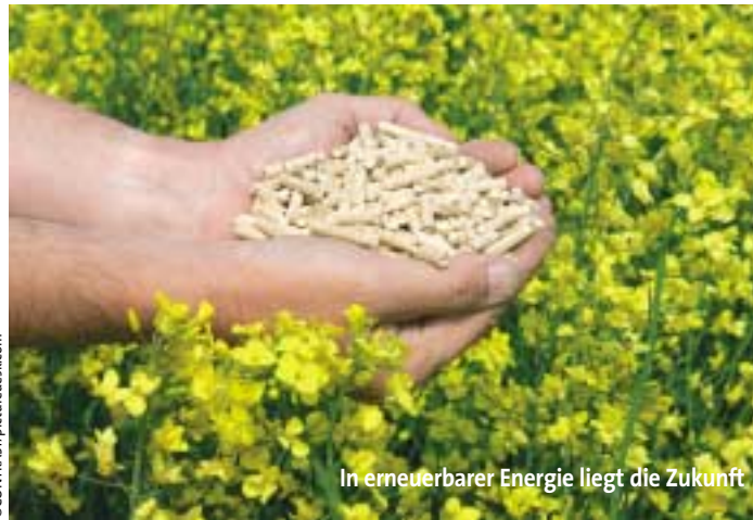
In erneuerbarer Energie liegt die Zukunft

Zentrums noch heuer dem Landeshauptmann vorlegen. Unter dem Titel Renewable-Competence-Center Carinthia (R3C) wird das Kompetenzzentrum in Kärnten firmieren. Es wird in eine Forschungseinheit (Research Center) und eine Umsetzungs- bzw. Vertriebseinheit (Solution Center) aufgeteilt sein. ■