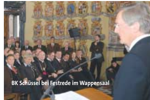
BK Schüssel bei Festrede im Wappensaal