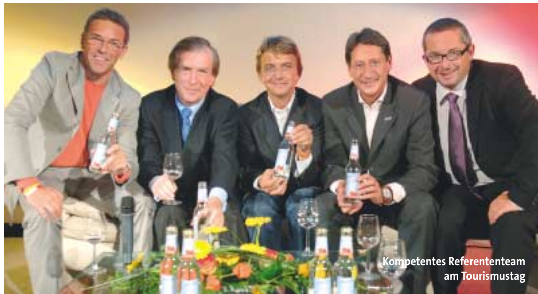
Kompetentes Referententeam am Tourismustag

„Kärntens Tourismus steht jetzt vor wichtigen Weichenstellungen und es gilt, sich von vielen liebgewonnenen Gewohnheiten zu befreien und zu verabschieden“, betonte der Landeshauptmann. Er sprach sich für einen großen touristischen Dialog im Land sowie das nachhaltige Verfolgen gemeinsam entwickelter Strategien aus. Dazu will Haider die Kraft in der Kärntner Tourismuswirtschaft mobilisieren. Dem „Jammern“ hingegen erteilte er eine klare Absage. Die von allen Referenten des Tourismustages angesprochenen Kernthemen waren der Aufbau eines