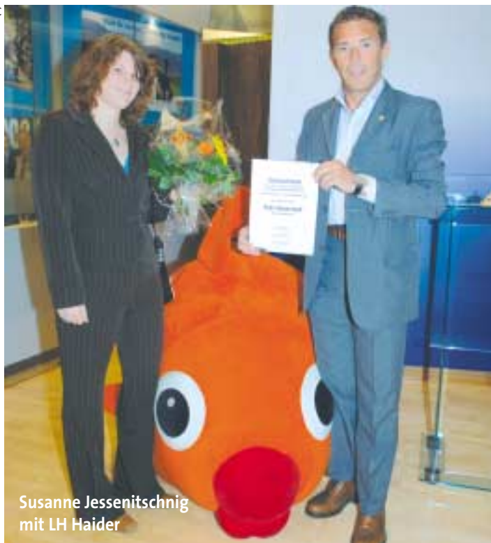
Susanne Jessenitschnig mit LH Haider

Die Erlebnisreise „Kärnten wasser.reich“ lockt zahlreiche Menschen an mystische, interessante, beeindruckende und einfach nur wunderschöne Plätze des Landes. Die „Zeit für Kärnten“ hat nun auch einige ihrer Leser auf die Spuren des Wassers geschickt. Das Gewinnspiel der September-Ausgabe wartete nämlich mit tollen Preisen auf.