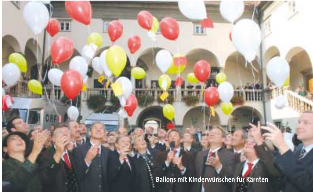
Ballons mit Kinderwünschen für Kärnten

Landeshauptmann Jörg Haider skizzierte bei den Feierlichkeiten zum 10. Oktober den Sonderweg Kärntens im Abstimmungsjahr 1920. „Damals haben sich Menschen zweier Sprachen und Kulturen nicht in die Sackgasse des Nationalismus locken lassen, sondern für die Gemeinsamkeit gekämpft und auf Heimatbewusstsein gesetzt.“ Von allen Festrednern wurde hervorgehoben, dass es ohne Abwehrkampf keine Volksabstimmung gegeben hätte. Das eindeutige Bekenntnis der Kärntnerinnen und Kärntner beider Volksgruppen zur Landeseinheit und jungen Republik Österreich wurde als noch heute für Österreich bedeutenden Schritt gewürdigt. So meinte Bundeskanzler Wolfgang Schüssel im Wappensaal des Klagenfurter Landhauses, dass Kärnten „ein leuchtendes Beispiel der Hoffnung“ abgegeben hat, als wenige an Österreich geglaubt haben. ■