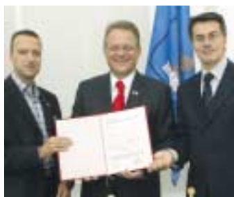
LHStv. Ambrozy mit Assessore Tosi (li) und Assessore Beltrame (re)

E in europaweit einzigartiges Projekt im Gesundheitsbereich wurde kürzlich in Klagenfurt fixiert: Die Gesundheitsreferenten von Kärnten, Friaul-Julisch Venetien und Veneto unterzeichneten den Gründungsvertrag für eine gemeinsame Internationale Akademie für Gesundheitsberufe. In einer Pressekonferenz skizzierten LHStv. Peter Ambrozy, Assessore Ezio Beltrame und Assessore Flavio Tosi den zukünftigen Aufgabenbe-