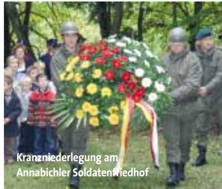
Kranzniederlegung am Annabichler Soldatenfriedhof